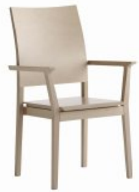
RIO 2013-1-03 H97 W57 D61 SH46