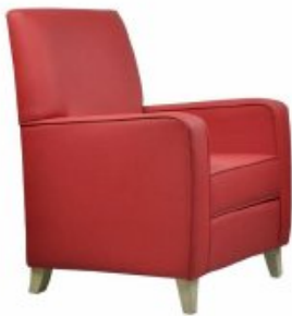
FREELIFE 5 H95 W75 D75 SH46

Comfortable armchair, timeless and elegant design