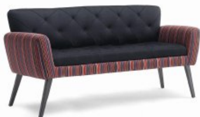
UPSIDE-DOWN 3 H80 W193 D62 SH46

Divanetto imbottito con gambe in legno Upholstered settee with wooden legs