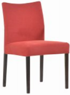
ENJOY 7 H90 W50 D63 SH46