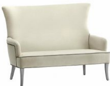
AMAZON 2012-1-11 H120 W130 D84 SH46

Poltrona imbottita, schienale alto Armchair upholstered, high back