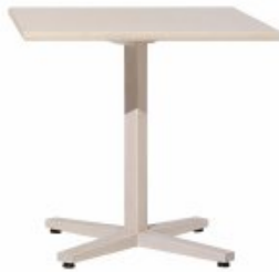
TABLE WITH LEG PILLAR H. GAMBE/LEG CM 72