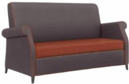
HARMONY 2014-1-08 H100 W160 D77 SH46

Poltrona imbottita, gambe legno Upholstered armchair, wooden legs