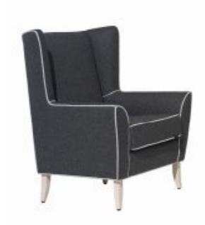
DINKY 1 H108 W85 D82 SH46

Wing-back armchair of modern style. Generous dimensions for superior comfort to all people.