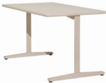
TABLE WITH LEG SIDE H. GAMBE/LEG CM 72