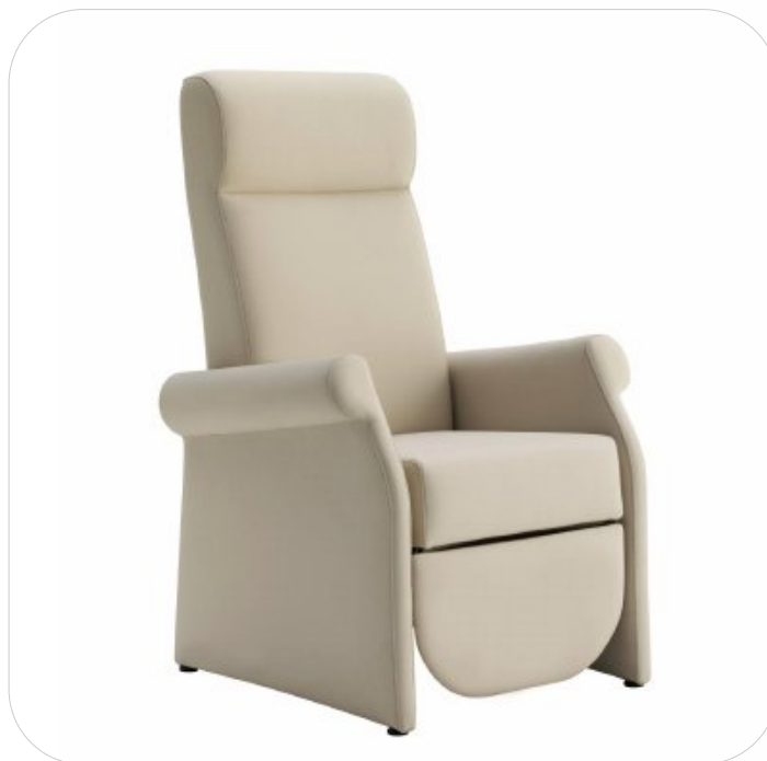
H120 W72 D75 SH46

Armchair with manual mechanism. Syncro movements of back and legrest and addition separate independent movement of the back by gas spring.