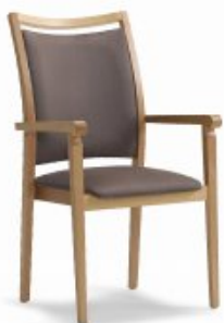
ENJOY 6 H98 W56 D63 SH46