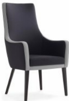
FLOWER 2013-1-26 H110 W67 D70 SH46

Poltroncina imbottita, gambe in legno di faggio Armchair upholstered, beechwood legs