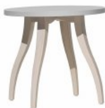
LOW TABLE WITH LEG FLEXINHA H. GAMBE/LEG CM 56