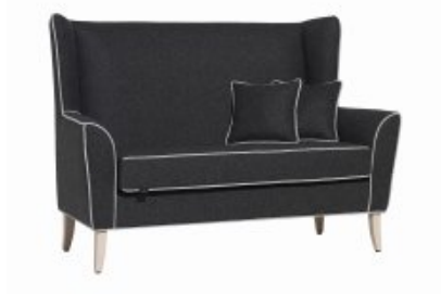
DINKY 2 H108 W150 D82 SH46

Poltrona imbottita, schienale con orecchie Wingback upholstered armchair