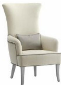
AMAZON 2012-1-10 H120 W73 D84 SH46

Comfortable and warm welcoming armchair of sophisticated and elegant style.