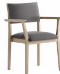
RIO 2013-1-08 H84 W57 D56 SH46