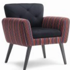
UPSIDE-DOWN 1 H80 W80 D62 SH46

The sense of hospitality. Distinctive and elegant design. Premium grade quality