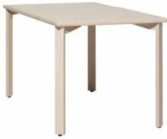
TABLE WITH LEG SLIM H. GAMBE/LEG CM 72