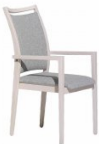
ENJOY 4 H98 W56 D63 SH46