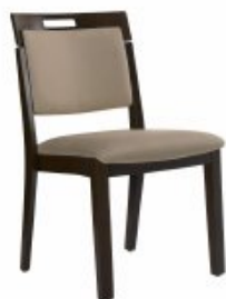
LINEA 2007-1-12 H86 W48 D60 SH46

Chair suitable for use in any environment. Product of great comfort thanks to the backrest elegantly curved and ergonomic.