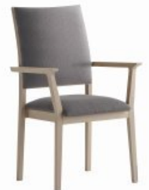
RIO 2013-1-09 H97 W57 D61 SH46