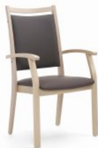
SEAT HEIGHT 51 CM ADA 2007-1-06H H92 W56 D60 SH51