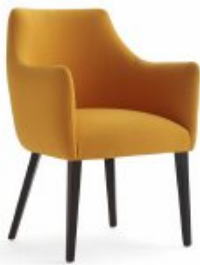
FLOWER 2013-1-25 H84 W62 D60 SH46

Elegant, light multipurpose armchairs, perfect to fit around the tables of a cafe or restaurant.