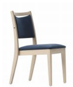
WIND 1 H81 W48 D60 SH46