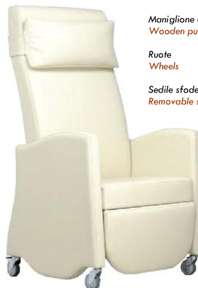
H123 W64 D70 SH46

Sedile sfoderabile con protezione antiurina Removable seat cover with moisture barrier