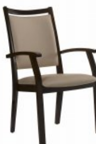
ADA 2007-1-07 H98 W56 D60 SH46