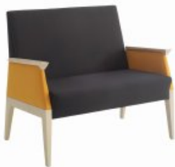
RIO 2013-1-12 H95 W126 D70 SH46