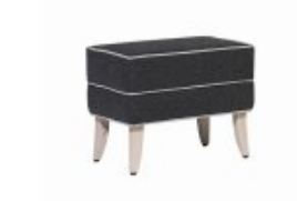
DINKY B H46 W40 D55

Divanetto imbottito, schienale con orecchie Upholstered settee, wingback