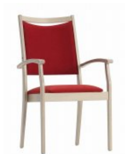
WIND 3 H96 W56 D60 SH46