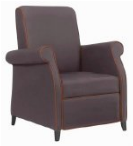
HARMONY 2014-1-07 H100 W74 D77 SH46

Extra secure soft seating. Built with safety in mind for intensive use