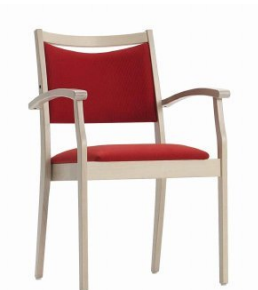
WIND 2 H81 W56 D60 SH46