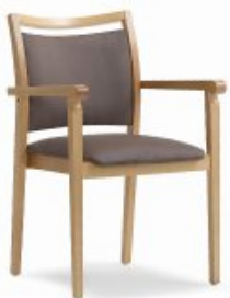
ENJOY 5 H88 W56 D63 SH46