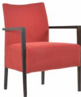
ENJOY 9 - Armchair H90 W65 D70 SH46