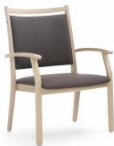
BARIATRIC ADA 2007-1-07XXL H98 W66 D65 SH48