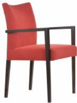
ENJOY 8 H90 W56 D63 SH46