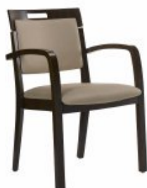
LINEA 2007-1-13 H86 W56 D60 SH46