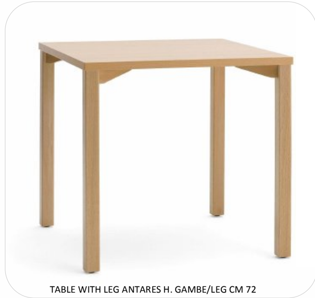
TABLE WITH LEG ANTARES H. GAMBE/LEG CM 72