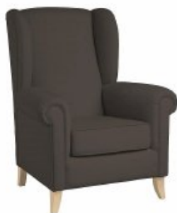
TIMES 1 H110 W85 D82 SH46

Unique style armchair. Very popular and well appreciated model.