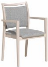
ENJOY 3 H88 W56 D63 SH46