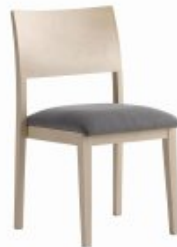
RIO 2013-1-04 H84 W47 D56 SH46