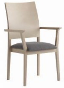
RIO 2013-1-06 H97 W57 D61 SH46