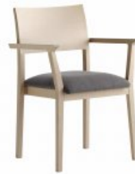
RIO 2013-1-05 H84 W57 D56 SH46