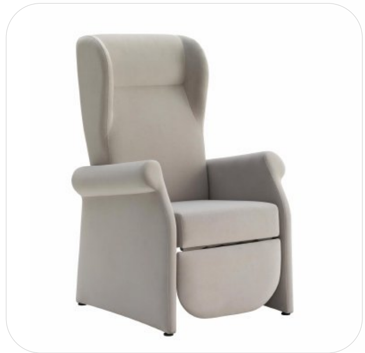
H120 W72 D75 SH46

Armchair with manual mechanism. Syncro movements of back and legrest and addition separate independent movement of the back by gas spring.