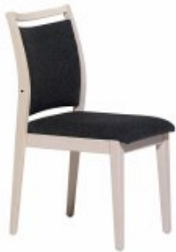
ENJOY 2 H98 W47 D63 SH46