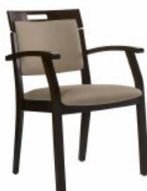
LINEA 2007-1-14 H86 W56 D60 SH46