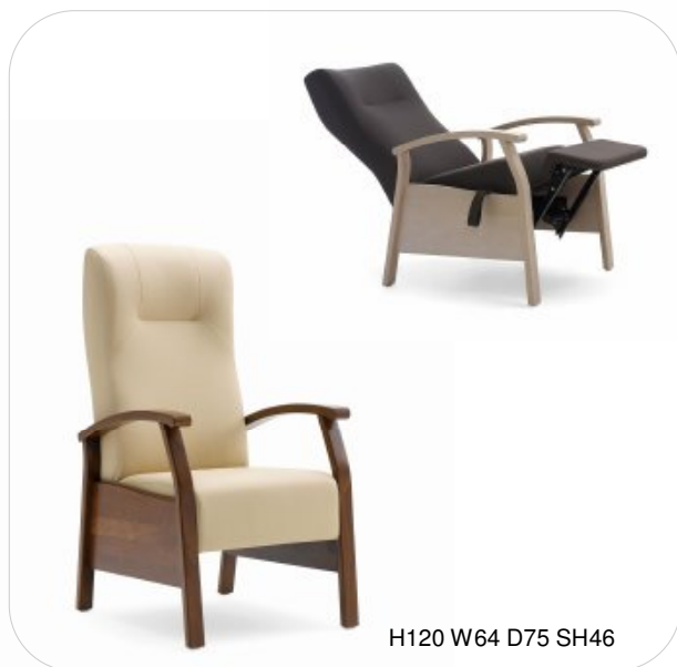
H120 W64 D75 SH46