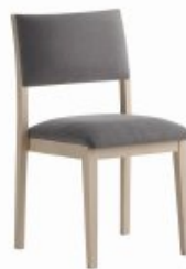
RIO 2013-1-07 H84 W47 D56 SH46