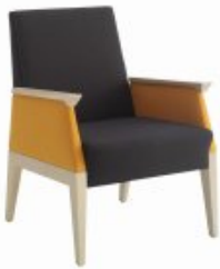
RIO 2013-1-11 H95 W66 D70 SH46