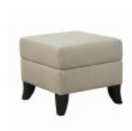
TIMES B H46 W51 D51

Divanetto imbottito, schienale con orecchie Upholstered settee, wingback