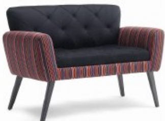
UPSIDE-DOWN 2 H80 W143 D62 SH46

Poltroncina imbottita con gambe in legno Upholstered armchair with wooden legs